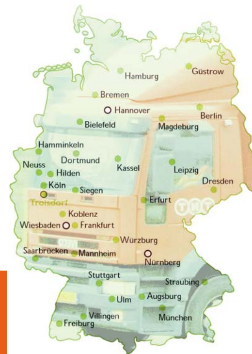
TNT Express in Deutschland

Internationaler Konzern: Das schnell wachsende Unternehmen wird ab 1969 auch in Europa aktiv und baut europäische Netze für die Expressfracht auf. 1996 übernimmt die niederländische Post den TNT Konzern. Seit 2005 wird das Unternehmen unter der Bezeichnung TNT N.V. geführt. Es ist in verschiedene operativ tätige Post- und Expressdienstleistungsunternehmen aufgliedert.