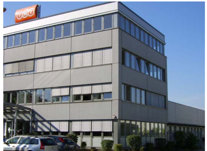
TNT Niederlassung Köln; Verwaltungsgebäude im Vordergrund links und Halle im Hintergrund rechts

Die 75 Transporter oder Local Trucks der selbstständigen Unternehmer transportieren in der Zeit von 8:00 Uhr bis 19:30 Sendungen unterschiedlicher Art und Größe mit einem Gesamtgewicht von 75 Tonnen. In dieser Zeit holen sie Päckchen, Pakete und Waren von den Kunden im Einzugsgebiet ab und sie liefern Sendungen an die Empfänger im Einzugsgebiet ab.